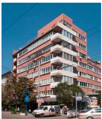
Жилищна сграда Арх. Р. Радославов, К. Джангозов София 1938-39 Wohngebäude Arch. R. Radoslavov, K. Dzjanzozov Sofia 1938-39