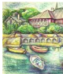
Трявна - старият град Рисунка - Мариана Ердьоди-Калинова

Една голяма част от нас, потомците, живее зад граница, занимава се с изкуство, дизайн, музика, преподавателска дейност, но това богато семейно наследство ни задължава да представяме достойно страната, от която идваме. И ние се гордеем с изкуството на България - наш непресъхващ извор на вдъхновение и самочувствие. ★