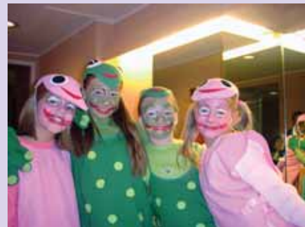
Wiener Kinderoper / Sanev „Weihnachts-Pyjamaparty“