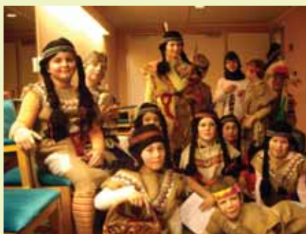
Виенска детска опера / Занев „Моа, индианският син“

„Не може да играеш пред децата чувството любов, или трябва да ги обичаш и те чувстват това, или не бива да им го имитираш.“