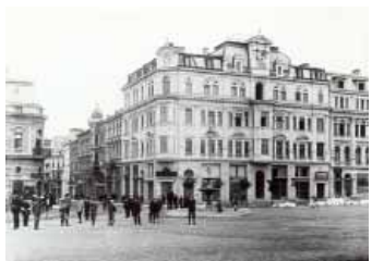
Офис сграда „Балкан“ Арх. Грюнангер, София 1904-13 г. Bürogebäude „Balkan“ Arch. Grünanger, Sofia 1904-13