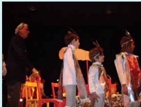
Виенска детска опера / Занев „Коледно пижамено парти“