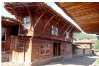
Дървена къща в село Жеравна XVIII-XIX в. Holzhäuser in Dorf Sheravna 18.-19. Jhdt.