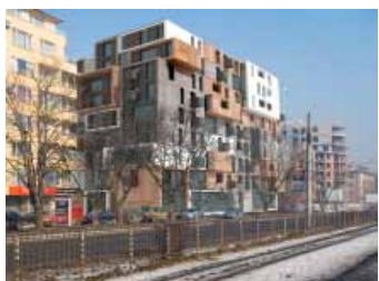
Жилищен блок Арх. студио „Аедес“ 2007 Wohnblock Architekten Aedes Studio, Sofia 2007