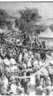
Tryavna - ein Fest in den 40-er Jahren