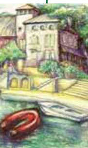
Tryavna - die alte Stadt