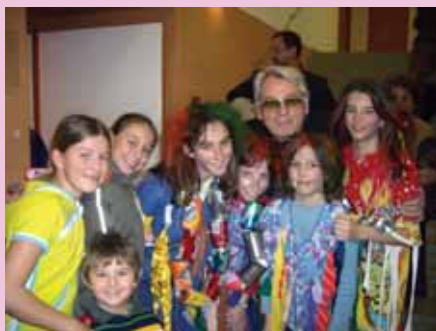
Виенска детска опера / Занев „Моцарт, Винету и смелият рицар Зелена Гора“

In meiner Familie sind alle Künstler, daher ist die Familie für mich nicht nur mein Zuhause, sondern auch der kleinste Arbeitskreis. Meine Frau ist ehemalige Solotänzerin des Ballettensembles der Oper in Varna. Meine Tochter ist Bühnenausstatterin und Fotografin. Eigentlich stellen wir alle ein Minimodel eines Theaters dar. Das einzige, was nicht gegeben ist, sind die Intrigen, und deshalb leben wir sehr glücklich.