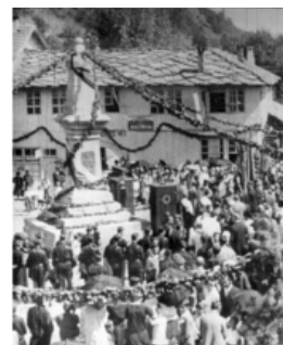
Трявна - старият град Честване на празник около 1940 год.