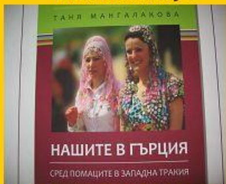
Die Bulgaren in Griechenland